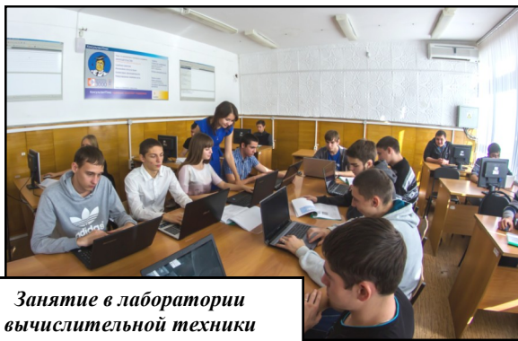
Занятие в лаборатории вычислительной техники