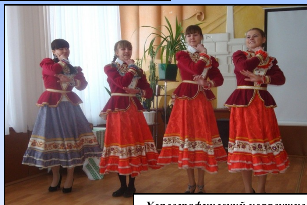
Хореографический коллектив колледжа