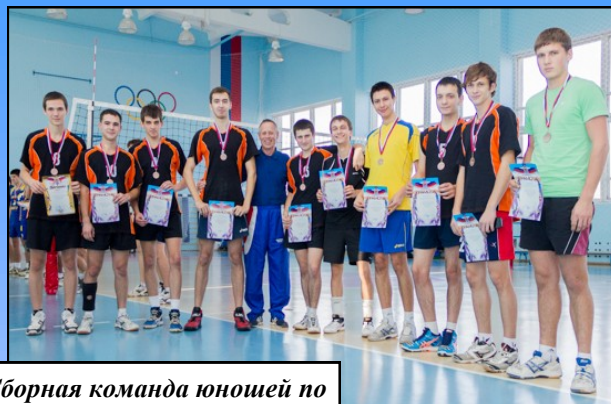
Сборная команда юношей по волейболу