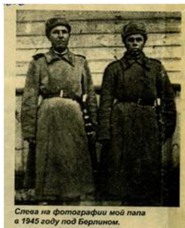
Слева на фотографии мой папа в 1945 году под Берлином.

Источник информации: воспоминания родственников, семейный фотоархив.